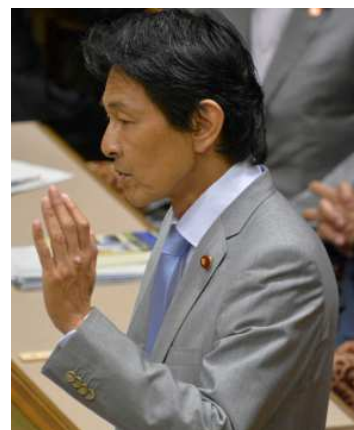
6月17日党首討論にて

日本人が 唯一の被爆国、平和国家としての国際的地位に誇り を持ち続けられるよう、徹底審議を行い、 歯止めを かけていきます。